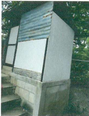
FOTO 3: Mejoramiento de baños en el cambio de puertas, separar los baños con tabla yeso, instalación de gradas y banquetas

Observación: Si es necesario se pueden agregar hojas adicionales y actualizar el número de hojas.