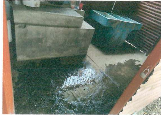
FOTO 2: Mejoramiento de cocina, instalación eléctrica, banqueta, block, entre otros